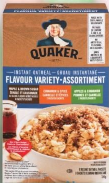
Quaker instant oatmeal selected varieties grau instantané Quaker certaines variétés 232-344 g 21190260_EA