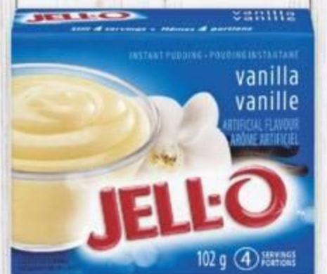
Jell-O instant pudding selected varieties pouding instantané Jell-O certaines variétés 32-113 g 20307001001_EA