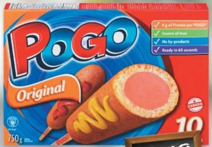
POGO selected varieties, frozen POGO certaines variétés, surgelé 8/10's/un. 20053302001_EA