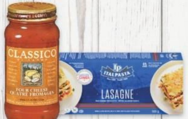
Italpasta 375-500 g, Classico pasta or pizza sauce 410/650 mL selected varieties pâtes Italpasta, sauce pour pâtes ou pizza Classico certaines variétés 20313491002_EA/20323101006_EA