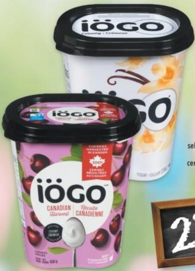
iÖGO yogurt selected varieties yogourt iÖGO certaines variétés 650 g 20705470001_EA 21219011_EA