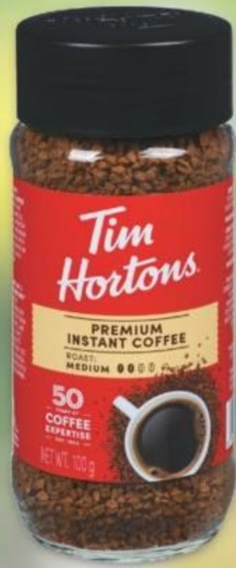
Tim Hortons instant coffee selected varieties café instantané Tim Hortons certaines variétés 100 g 21167584_EA