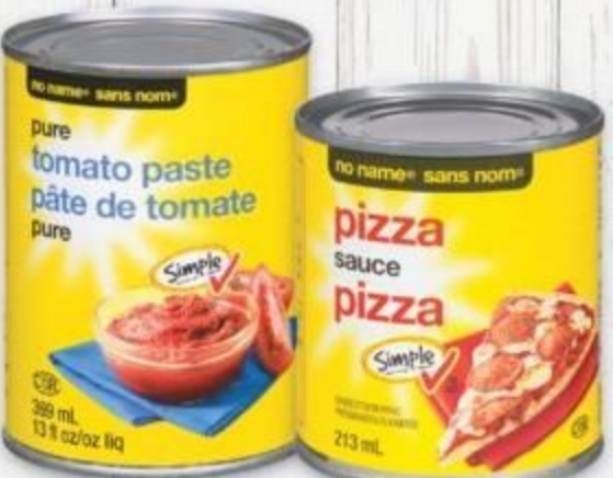
no name® pizza sauce 213 mL or tomato paste 369 mL sauce à pizza ou pâte de tomate sans nom® 20018020_EA/20056697_EA