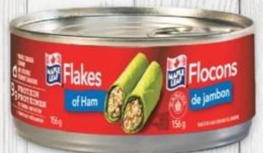
Maple Leaf flakes selected varieties flocons Maple Leaf certaines variétés 156 g 20298273001_EA