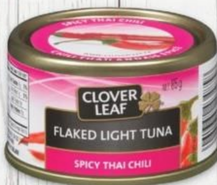
Clover Leaf light tuna selected varieties thon pâle Clover Leaf certaines variétés 85 g 20315581001_EA