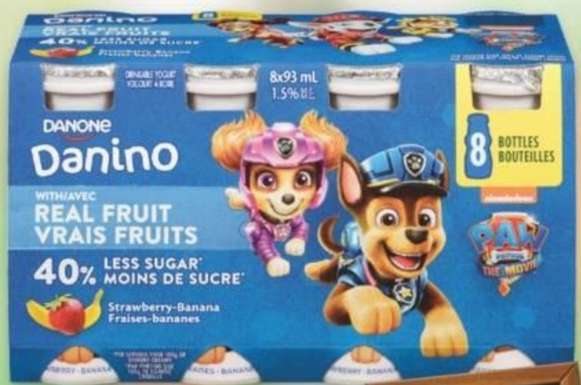
Danino drinkable yogurt selected varieties yogourt à boire Danino certaines variétés 8 x 93 mL 20316360002_EA