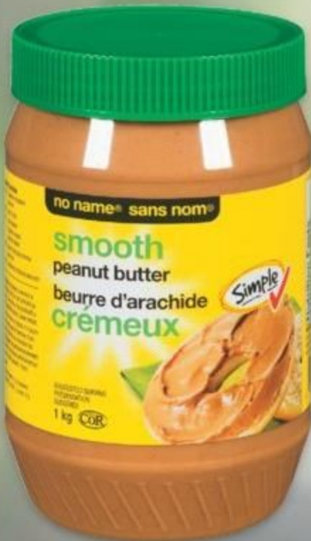
no name® peanut butter selected varieties beurre d'arachide sans nom® certaines variétés 1 kg 20296985001_EA