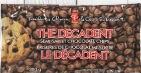
PC® The Decadent® chocolate chips selected varieties brisures de chocolat PC MD Le décadent MC certaines variétés 226-300 g 20011473_EA