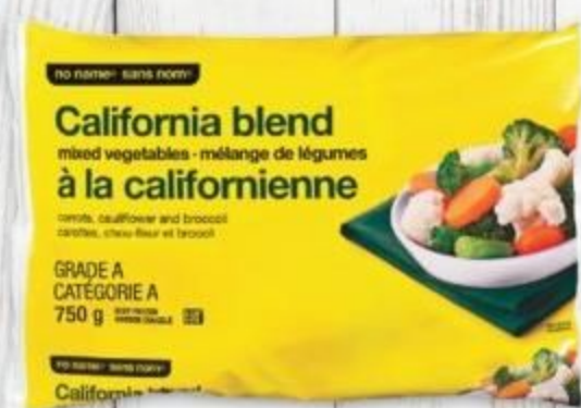
no name® vegetables selected varieties, frozen légumes sans nom® certaines variétés, surgelés 750 g 20316412_EA