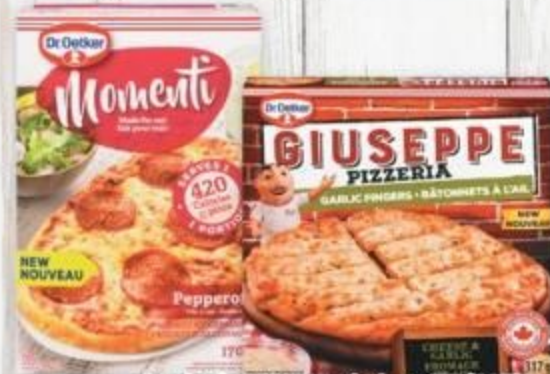
Dr. Oetker Momenti pizza 170/185 g, Giuseppe garlic fingers or bruschetta 317/405 g selected varieties, frozen pizza Momenti, bâtonnets à l'ail ou bruschetta Giuseppe Dr. Oetker certaines variétés, surgelés 21164021_EA/21236985_EA