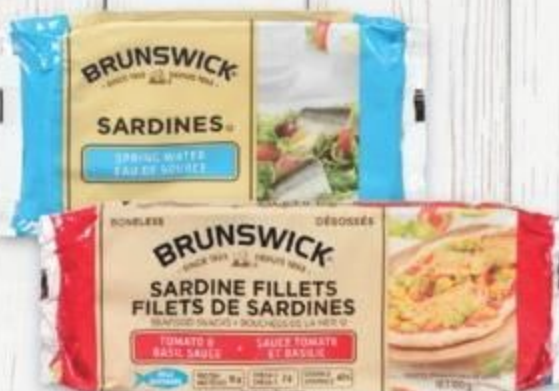
Brunswick fillets 100-106 g or sardines 106 g selected varieties filets ou variétés Brunswick certaines variétés 20318426002_EA/20322242001_EA